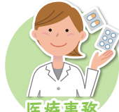
医療事務 受験対策講座